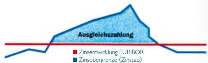
Der 3-Monats-EURIBOR der letzten 10 Jahre